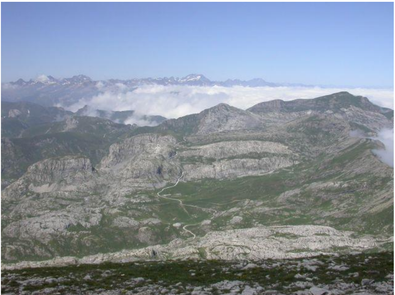
Photo 1: vue vers l'Ouest depuis l'Est du massif du Marguareis

Ce présent document constitue la note de synthèse finale reprenant les principales informations issues des 3 tomes. C'est un outil qui permet une prise de connaissance rapide du site, de sa richesse et des enjeux en présence.