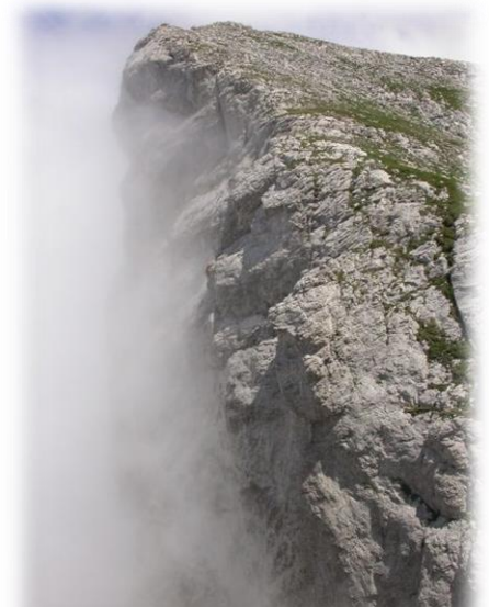
Photo 5: habitat 8210 de pentes rocheuses calcaires avec végétation chasmophytique

Ces objectifs sont déclinés en 21 mesures concrètes à mettre en œuvre dans la phase animation du site. Il faut également signaler la continuité du site avec un autre site Natura 2000 : La Bendola. Cette particularité est à prendre en compte, surtout pour les habitats qui se retrouvent dans les deux sites et les continuités écologiques , afin d'assurer une cohérence de gestion . D'autres sites se trouvent à proximité (en Italie notamment) et certaines espèces peuvent utiliser plusieurs de ces sites. La notion de réseau européen prend donc ici tout son sens dans les interrelations établies par le biais de corridors écologiques qui ne dépendent pas de frontières administratives. Après plusieurs années d'élaboration du DOCOB, le site va donc entrer dans sa phase d'animation . Elle consiste à faire vivre le site en favorisant les projets durables de territoire grâce aux outils propres à Natura 2000 (contrats, charte) et en informant et sensibilisant les acteurs socioprofessionnels sur la manière d'atteindre les objectifs définis dans le DOCOB. Respectueux de la concertation réalisée pendant la phase d'élaboration, l'animateur accompagne les acteurs locaux pour favoriser un développement harmonieux de leur territoire et valoriser la richesse d'un patrimoine unique . Propriétaires, exploitants ou utilisateurs sont ainsi invités à participer à la bonne gestion du site .