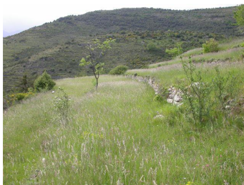
Photo 2: habitat prioritaire 6210 Site d'Orchidées remarquables (ONF 2009)