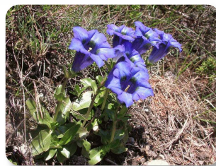
Gentiane de Ligurie