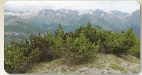
Fourrés à Pins mugo

De nombreuses espèces végétales sont présentes sur le site. Parmi les plus remarquables, nous pouvons citer la Gentiane de Ligurie, espèce endémique des Alpes sud-occidentales fortement représentée sur ce site, la Buxbaumie verte, l'Ancolie de Bertoloni, l'Ancolie des Alpes, le Lis turban, le Lycopode sélagine et l'Arnica des montagnes.