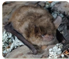
Murin à oreilles échanquées