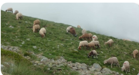
Moutons en alpage

Les activités humaines sont peu développées sur le site du Mont Chajol en raison de son positionnement géographique relativement excentré. Le pastoralisme est l'activité anthropique la plus représentée, l'élevage étant aujourd'hui un patrimoine culturel historique dynamique. Les pâturages sont gérés de manière extensive et soumis à la prédation du loup et à la concurrence avec certains habitats (forêts, fourrés). La préservation de l'activité pastorale est primordiale pour maintenir l'équilibre des habitats, notamment pour préserver les milieux ouverts.