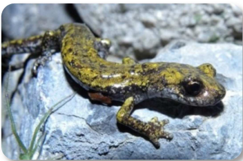
Spélerpès de Strinati

La faune du site est également très riche. Nous pouvons en effet noter la présence de 18 espèces de mammifères (hors chauves-souris), de 18 espèces de chauves-souris, de 41 espèces d'oiseaux observées (81 espèces potentiellement présentes sur le site), de 9 espèces de reptiles et d'amphibiens, d'une espèce de poisson, de 193 espèces de papillons, de 16 espèces de coléoptères et de 3 espèces d'orthoptères.