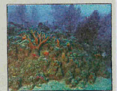
Massif coralligène.

lement menacée par les espèces invasives et les détériorations mécaniques. Les Cymodocées sont aussi des plantes à fleurs qui jouent un rôle de nurserie et sont menacées par des plantes invasives (comme la caulerpa taxifolia), et plus récemment la caulerpa racemosa). Présentes au Cap Martin et dans la