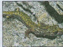
Le Spelerpès de Strinati.

Certaines prairies de la vallée de la Bendola (Saorge) concentrent une diversité et un nombre d'orchidées sauvages exceptionnel, parmi