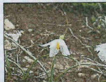
La Nivéole de Nice.