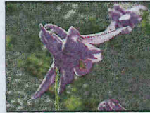
L'ancolie de Bertolini.

Cette fleur pousse dans les forêts rocailleuses de pins et dans les éboulis calcaires. Présente sur les 5 sites de la Riviera française.