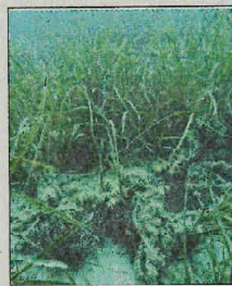
Herbiers de Posidonie, prairies de Cymodocées et nids de Picarels font la richesse des fonds marins méditerranéens.

mer », constituant un abri, une frayère et une nurserie pour des centaines d'espèces végétales et des milliers d'animaux : elle est le « poumon vert de la Méditerranée », car elle augmente en oxygène les fonds marins. Sur le secteur, elle est surtout présente au Cap Martin, au niveau de la baie de Cabbé. Elle est principa-