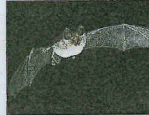
Rhinolophe euryale.