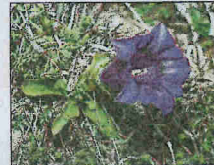
La gentiane de Ligurie.

les plus fortes en France (une cinquantaine d'espèces). La progression des friches et de la forêt, liée à l'abandon des pratiques agricoles menace ces espèces.