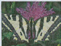
Le papillon Alexanor.

Cette fleur blanche existe uniquement dans les Alpes-Maritimes, de Nice à la frontière italienne. Elle pousse