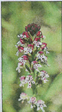
L'orchidée sauvage. accueille deux populations récemment découvertes à Menton et Castillon sur des secteurs très localisés. On peut l'apercevoir entre mars et avril.