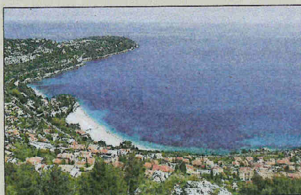
Le site du Cap Martin recèle une grande partie des fameux herbiers de Posidonie.

Posidonie : le « poumon vert » de la Méditerranée Ce site est caractérisé par la présence d'habitats remarquables, comme les herbiers de Posidonie, les prairies de Cymodocées, les massifs de coralligène, ainsi que des fonds abritant d'im-